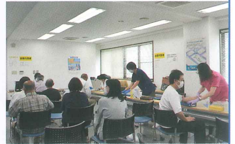
検診をまつ会員さん