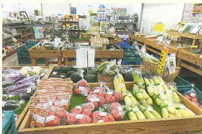
アグリハウスさかい

就農してしばらくは思うような品物は出来ませんでした。5年目位から町田市農業祭農業物品評会にて優秀賞に選ばれるようになり様々な品目で連続入賞を果たしています。また、地元の和菓子屋「明月堂」とのコラボで商品開発した、秋どり枝豆、紫芋、スーパースイートコーンなどを使った和菓子は好評でアグリハウスさかいで販売されています。